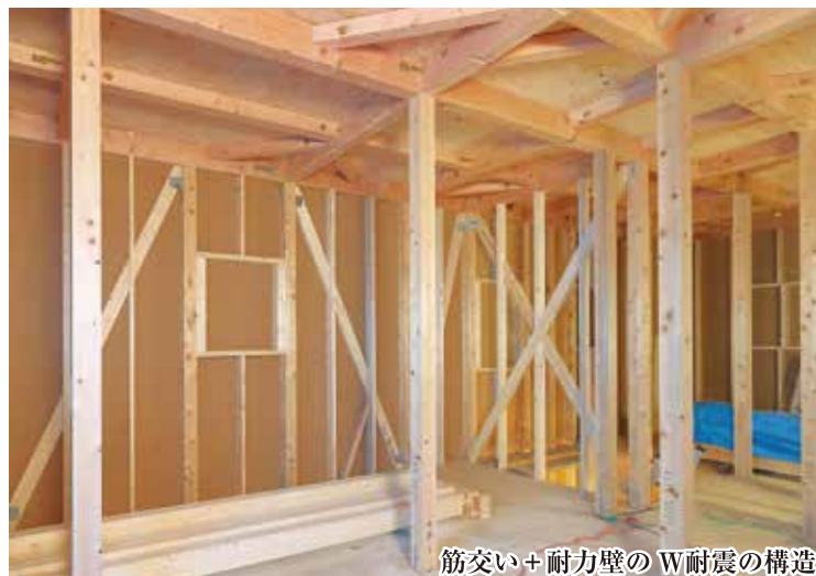
筋交い+耐力壁のW耐震の構造

「構造は見てわからない」そのような方のために構造見学会を開催しています。「安心して暮らす」という、家の基本は構造にあります。ひのきの柱、W耐震工法耐震金物、梁、ケタなど、長期優良住宅の構造を実際に一度ご覧になるだけで参考になると思います。見せかけだけではない本当の家の構造を、ぜひこの機会にご覧下さい。